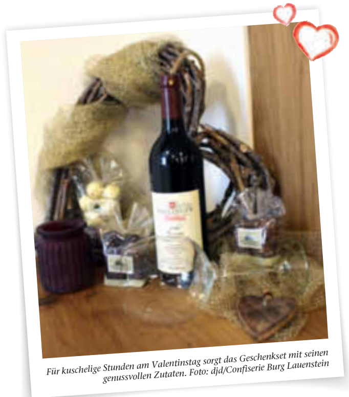
Für kuschelige Stunden am Valentinstag sorgt das Geschenkset mit seinen genussvollen Zutaten.