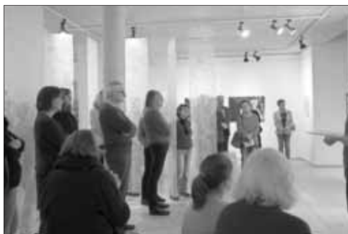
Die Besucher der Vernissage werden Teil der Installation

Das Museum ist bis zum 19.04.2020 geschlossen