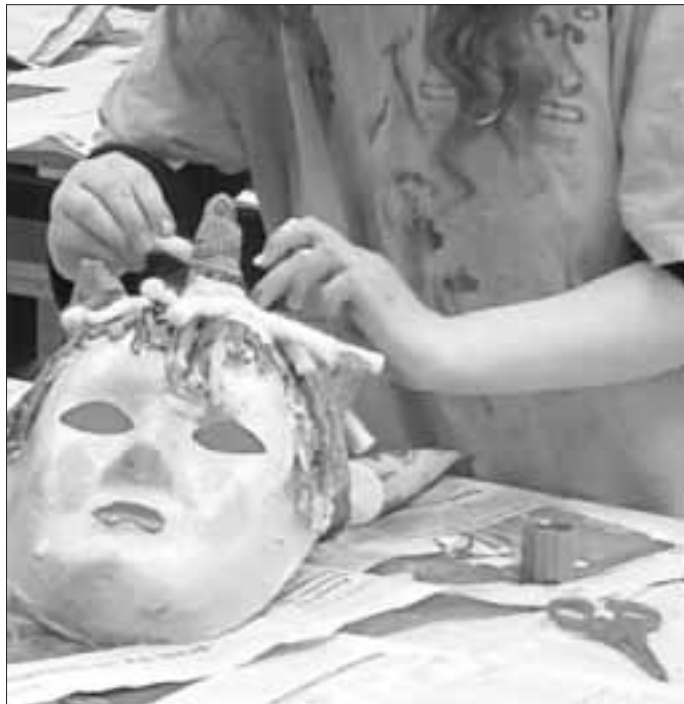
Kunterbunt und individuell gestalten Teilnehmerinnen im Projekt „Your Joice ihre Masken“

Nun bleibt abzuwarten, welche Geschichte sich die Mädchen zu ihren Masken ausdenken. Ihre Phantasie dürfen sie dabei auf alle Fälle wieder freien Lauf lassen. Bei dem Projekt handelt es sich um ein Gemeinschaftsprojekt des Vereins KRASS e.V., der Bildungskoordination für Neuzugewanderten des Landratsamtes sowie ProArbeit gGmbH, als Träger der Jugendsozialarbeit an Grund- und der Mittelschule Ichenhausen sowie des Familienstützpunktes. Das Projekt wird über das Programm „Künste öffnen Welten“ des Förderprogrammes „Kultur macht stark. Bündnisse für Bildung“ des Bundesministeriums für Bildung und Forschung gefördert. Das Bildungsministerium möchte mit dieser Förderung kulturelle Bildungsprojekte insbesondere für Kinder und Jugendliche zugänglich machen, die in Familien mit Risikolagen aufwachsen.