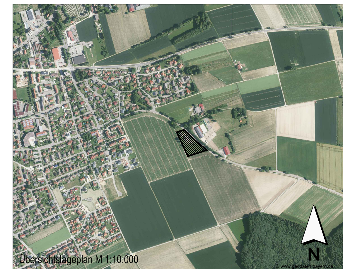
Übersichtslageplan M 1:10.000